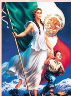
Allegoría de La Madre Patria, realizada por el pintor chihuahuense Jesús Helguera.

Esta publicación consta de un tiraje de 2 mil ejemplares.