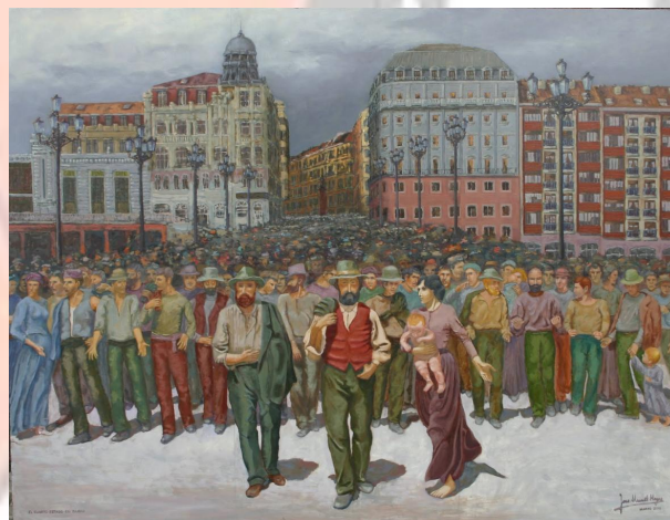
El Cuarto Estado en Bilbao (José Manuel Hoyos )

Visita nuestras páginas Web en construcción: