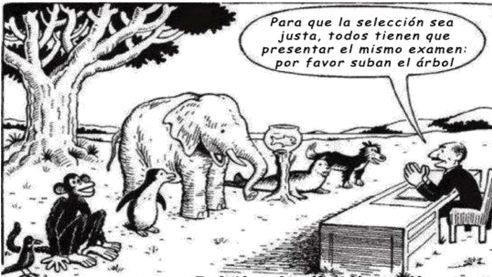
(Viene de la página 7)

sujetos involucrados querrán tener éxito en su labor; estarán dispuestos a indagar qué ha funcionado y qué aspectos de la tarea deben corregirse; y emprenderán acciones para modificar el rumbo y enmendar las deficiencias. Tal vez todo este proceso tarde, primero para reconocerse como necesario y después para construirse y reconstruirse hasta satisfacer a sus actores. Es más, probablemente no suceda. Pero una cosa es cierta: no hay poder externo capaz de sustituir a la voluntad, al compromiso y al deseo de esos actores.