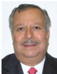
Rafael Ochoa G. Senador del PANAL