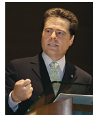
Eduardo Bours Gobernador de Sonora