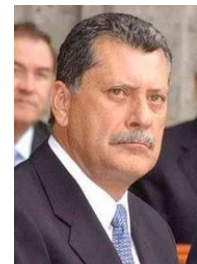
Enrique Jackson Suspirante por la presidencia del PRI