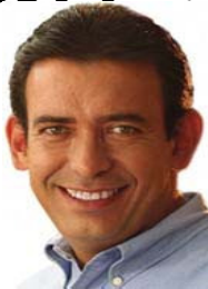
Humberto Moreira V Gobernador de Coahuila